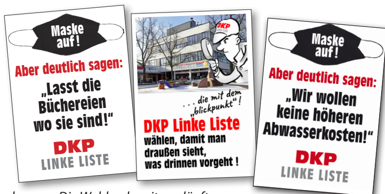
Die Wahlvorbereitung läuft. Erste Plakatideen wurden gezeigt und diskutiert.