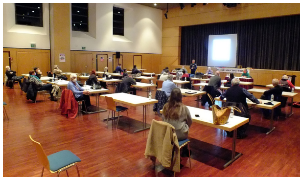
Unter Pandemie-Bedingungen saß man im großen Saal des Bürgerhauses weit auseinander.

In der Diskussion wurde mehrmals angesprochen: „Linke Opposition ist wichtiger als je zuvor!“